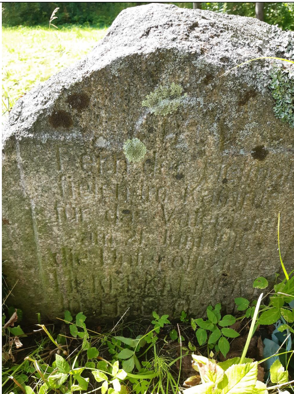
Unikalus kodas Kultūros vertybių registre 21274