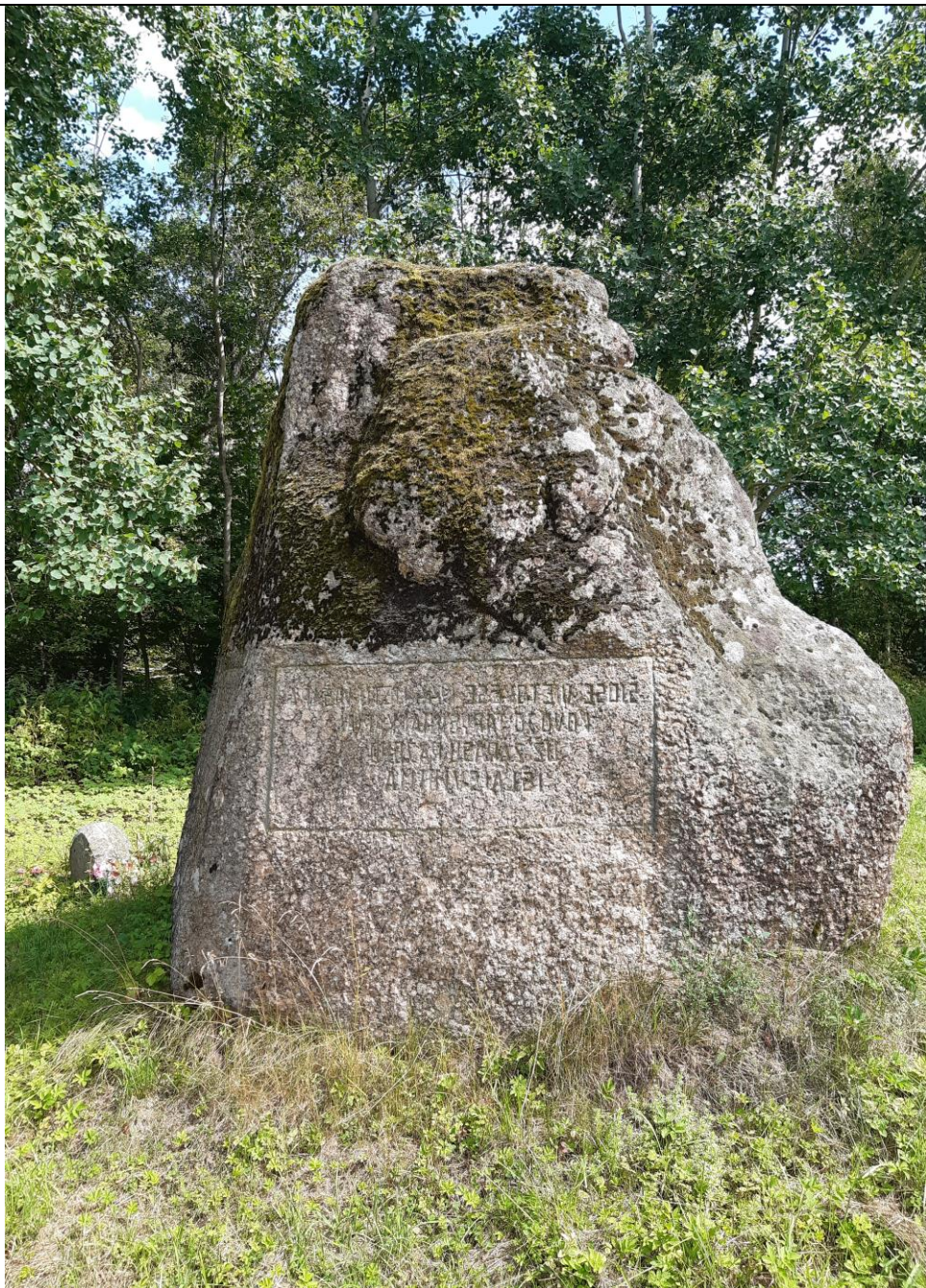
Unikalus kodas Kultūros vertybių registre 21274